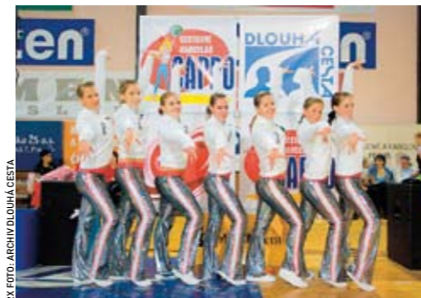
Loňská sportovní Neděle pro vaše srdce, jejíž výtěžek podpořil občanské sdružení Dlouhá cesta. Letos se benefice koná znovu 9. listopadu.

Ve Velké Británii mají podobných organizací, jako je Dlouhá cesta, asi sedm. „Existují tam organizace speciálně na pomoc těm, kterým vzala dítě nemoc, nebo těm, jejichž blízký